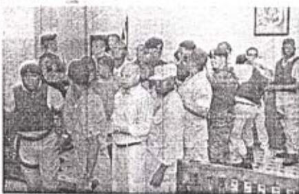
Acusados del caso Paya custodiados por agentes policiales.