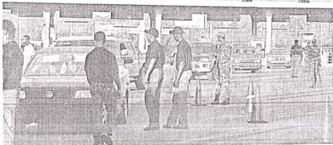
Agentes de la Policía Nacional y efectivos del Ejército realizan un operativo en el peaje de la autopista 6 de Noviembre, que conduce al sur del país, como parte de las operaciones iniciadas para dar con el paradero de la prófuga de la justicia Sobeida Félix Morel, mujer a la que se le vincula con el narcotraficante José Figueroa Agüero y al hallazgo de 46 millones de dólares producto del negocio de las drogas.