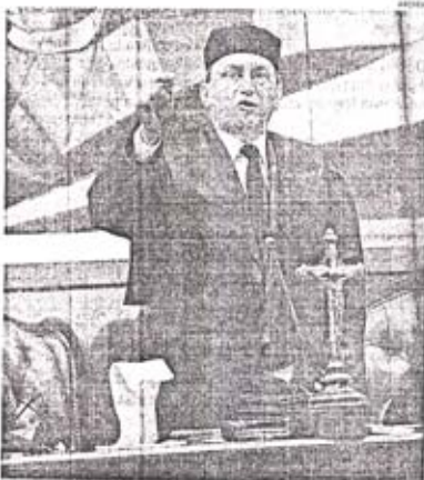
Autoridad. Jorge Subero Isa, presidente de la Suprema Corte de Justicia.