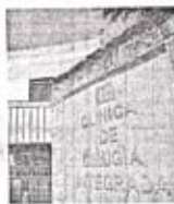
La Clínica allanada no abrió ayer