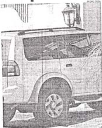
Esta vana entró y salió seguida de otra Jeep Lande negra, y movió una vana de la casa de Sobaida

Agentes de la Policía Nacional y de la Dirección Nacional de Control de Drogas (DNCD) impusieron el