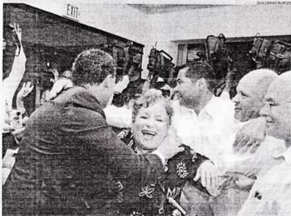
Se formó una gran algarabía en la sede del PNUD al anunciarse hoy que ese organismo considera no pertinente la construcción de

■ El Consorcio Minero Dominicano anunció hoy que había decidido reubicar la instalación de su planta procesadora P4