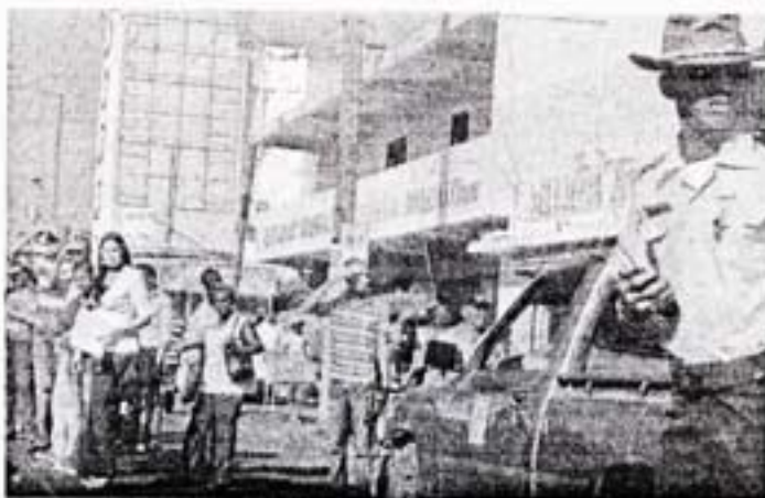
Muestra del sistema de tránsito en Santo Domingo.