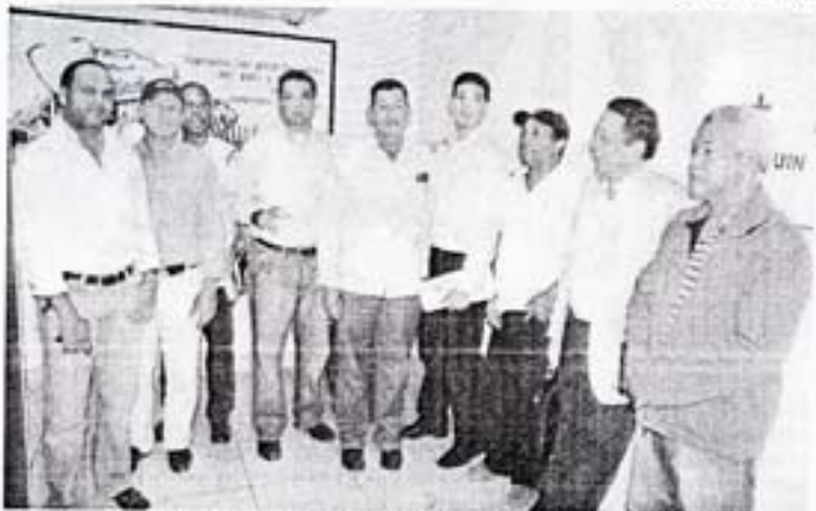
Moradores de Hatillo que entregaron copia de la carta en la redacción de El Nacional.

Además, existen inversiones y proyectos turísticos muy significativos, hechos con apego a las leyes vigentes, las cuales serían seriamente afectadas por el decreto 571-09.