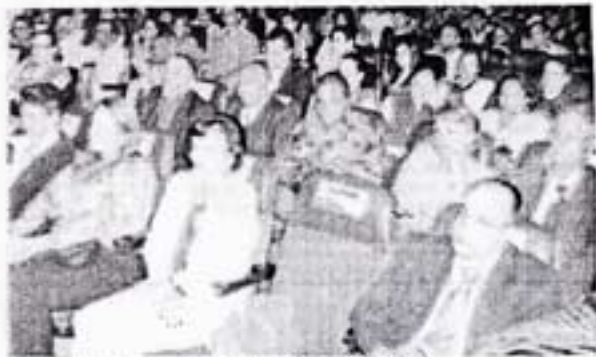
Parte del público que asistió.