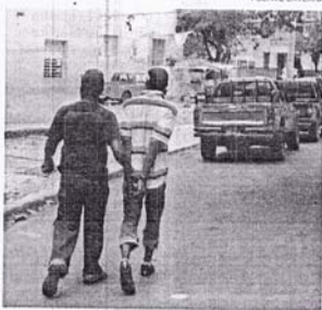
Un agente antinarcóticos conduce a una de los apresados.