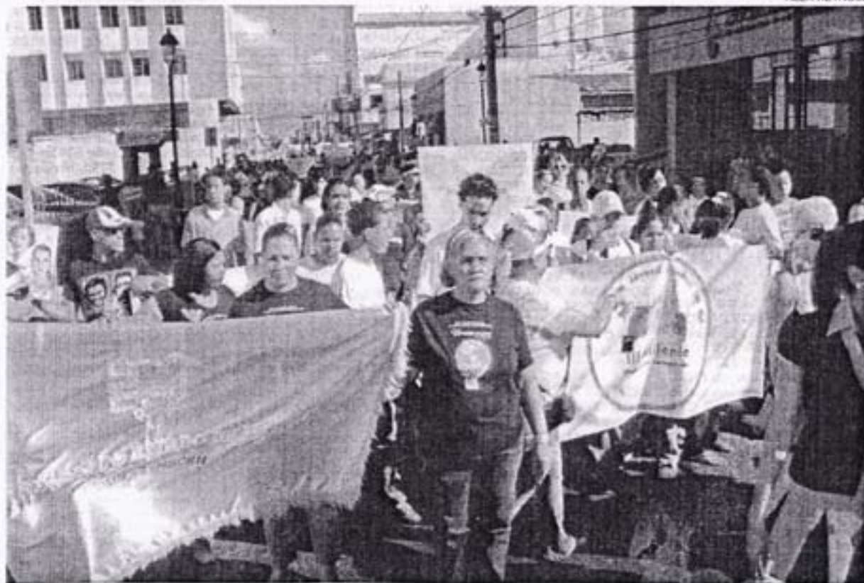
Cientos de personas marcharon a favor de la no violencia contra la mujer.

LUSBANIA SANTOS lusbaniasantos@gmail.com