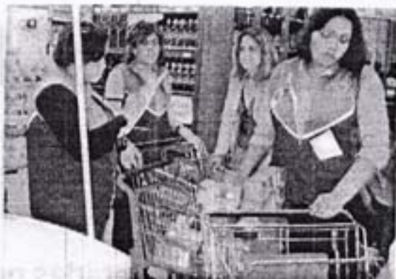
Inspectoras de Proconsumidor en uno de los operativos.