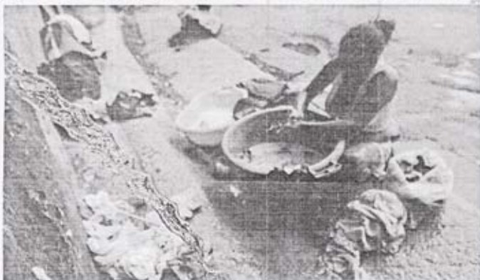
AGUR: Una mujer lava la ropa en la calle en un barrio populoso en el oeste de Caracas como consecuencia de los cortes en el servicio de agua de hasta 48 horas por semana, para frenar un déficit del 25 por ciento de la oferta de la ciudad. La duración de la estación seca no se espera que concluya hasta mayo de 2010.

■ Revela que los magistrados se han comprometido a aplicar las leyes P5