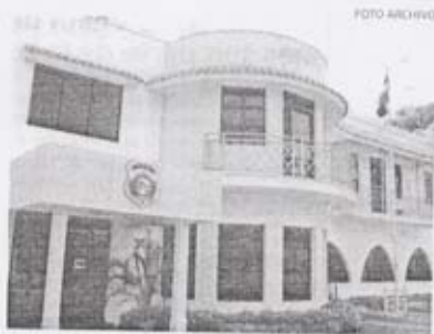
La ley prohíbe identificar a menores que delinquen.

Aclaró que "a pesar de que la DNCD tiene interés