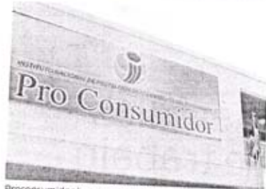
Proconsumidor hace operativos con mucha frecuencia.