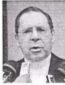
Monseñor Agripino Nuñez Collado