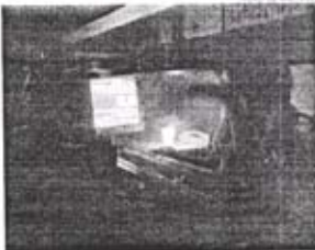
Usuarios dicen hay un desorden en las interrupciones.

Se dijo que el adolescente fue llevado al hospital Luis Eduardo Aylar