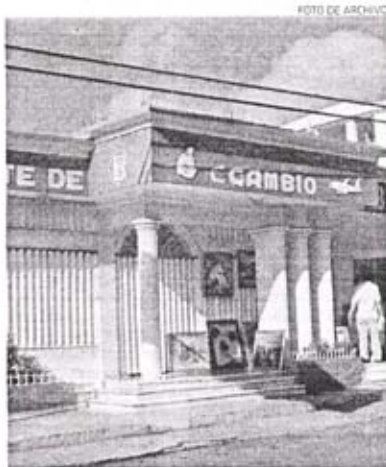
La casa de Cambio funcionaba en Nagua y Samaná, y fueron cerradas ayer por la Superintendencia de Bancos.