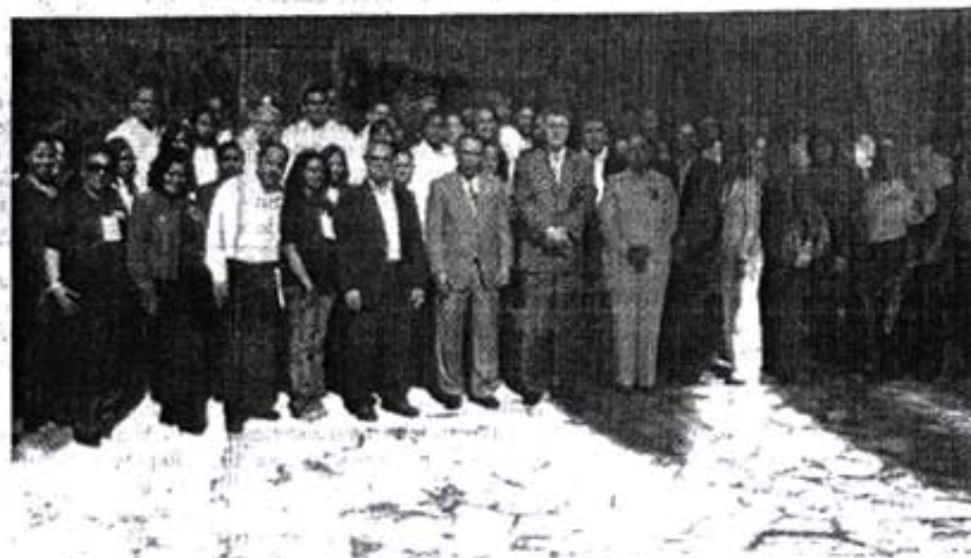
El procurador general de la República, Radhamés Jiménez Peña, junto a varias personalidades.

"Por esa opinión favorable que ha sido externada por funcionarios y periodistas que nos han dado el privilegio de visitar esos Centros de Corrección y Rehabilitación que tenemos funcionando, el apoyo de la Iglesia Católica y de empresarios que conforman el Patronato Nacional Penitenciario, el país recibió una certificación de la Organización de las Naciones Unidas que nos acredita como Centro Excelencia en la Buena Práctica Penitenciaria", afirmó.