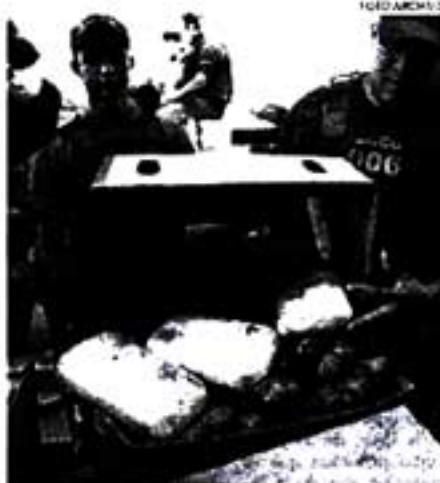
Forma en la que estaba empaquetada la droga.