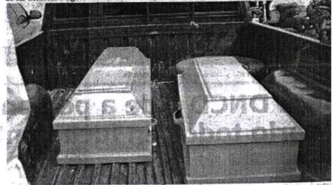
Los ataúdes con los cuerpos calcinados de los menores en la parte trasera de un camión.

En esa ocasión duró seis meses presa en la cárcel de La Vega, pero fue liberada por insuficiencia de pruebas aunque el padre de la menor aun mantiene la querrela en la Fiscalía de aquí.