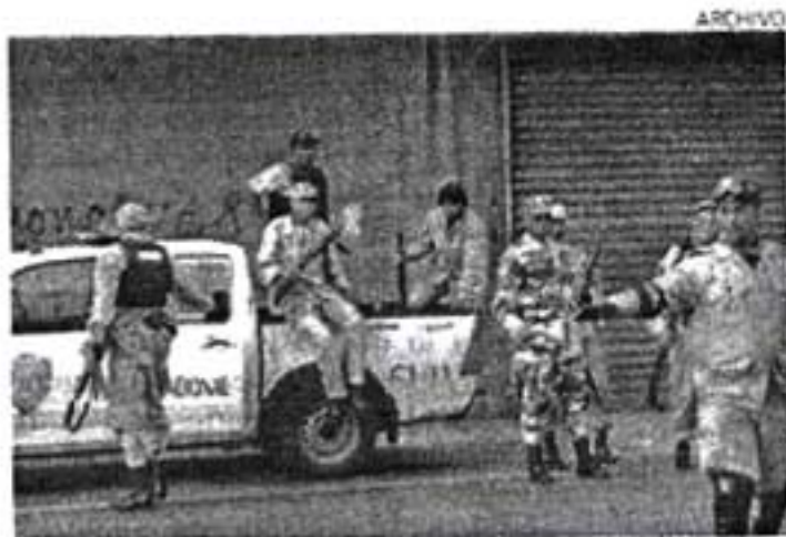
El joven que enfrentó la patrulla está interno en hospital.