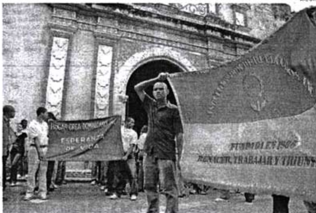
Hogares Crea entra en una situación sumamente difícil, debido a la falta de recursos

"Estamos casi en quiebra... Una de las amenazas